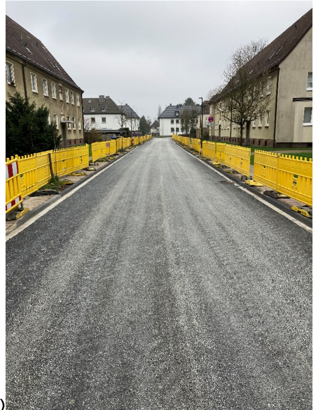
Virchowstraße - fertiggestellte Asphaltdeckschicht