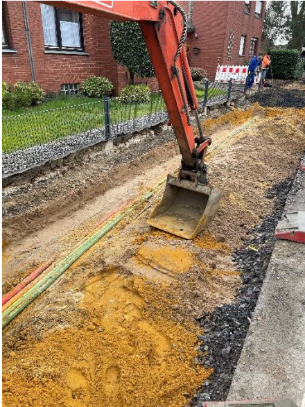
Querstraße - Umverlegung von Versorgungsleitungen im Bauabschnitt von Wirthstr. bis Niederadener Str. - östlicher Gehweg