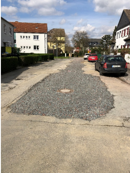
AugustastraÙe - Fertigstellung Kanalbau Bauende in Hhe der WestfaliastraÙe