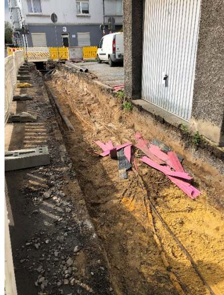
KirchhofstraÙe - Versorgungsleitungsbau im nrdlichen Gehweg im Bauabschnitt von KlarastraÙe bis Augustastrafe