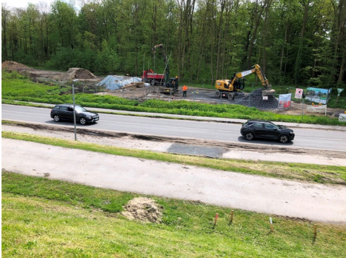
Br. Kamener Str.; Sondierungsbohrungen im Bereich des süd. Widerlagers