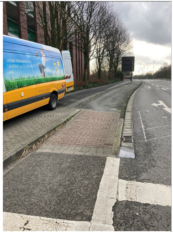
Soll-Zustand – Abbildung ähnlich.

Des Weiteren wurde die bestehende Fahrbahnmarkierung zwischen der Kurt-Schumacher-Straße und der Brücke über den Süggebach durch den Fachbereich Mobilitätsplanung und Verkehrslenkung überarbeitet.