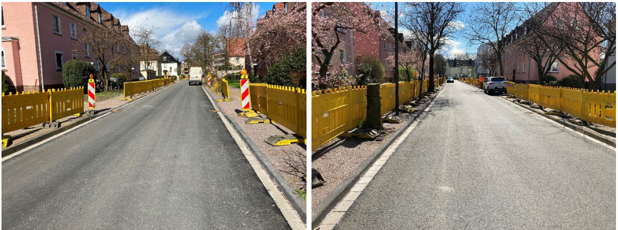
Behringstr. fertiggestellte Asphaltdeckschicht