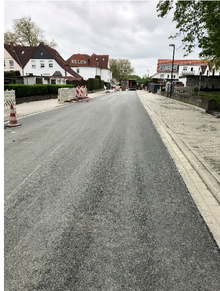
Querstraße - neu asphaltierte Fahrbahn im Bauabschnitt von Ebertstr. bis Wirthstr.