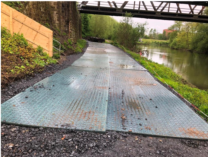
Bauzeitliche Zufahrt zum gepl. Süd. Widerlager Lippebrücke