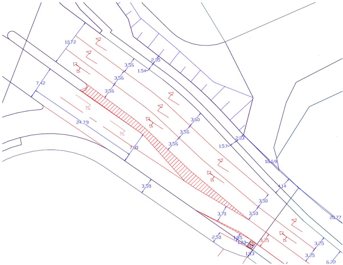
Markierungsplan Bebelstraße zw. Kurt-Schumacher-Straße und Brücke Süggelbach