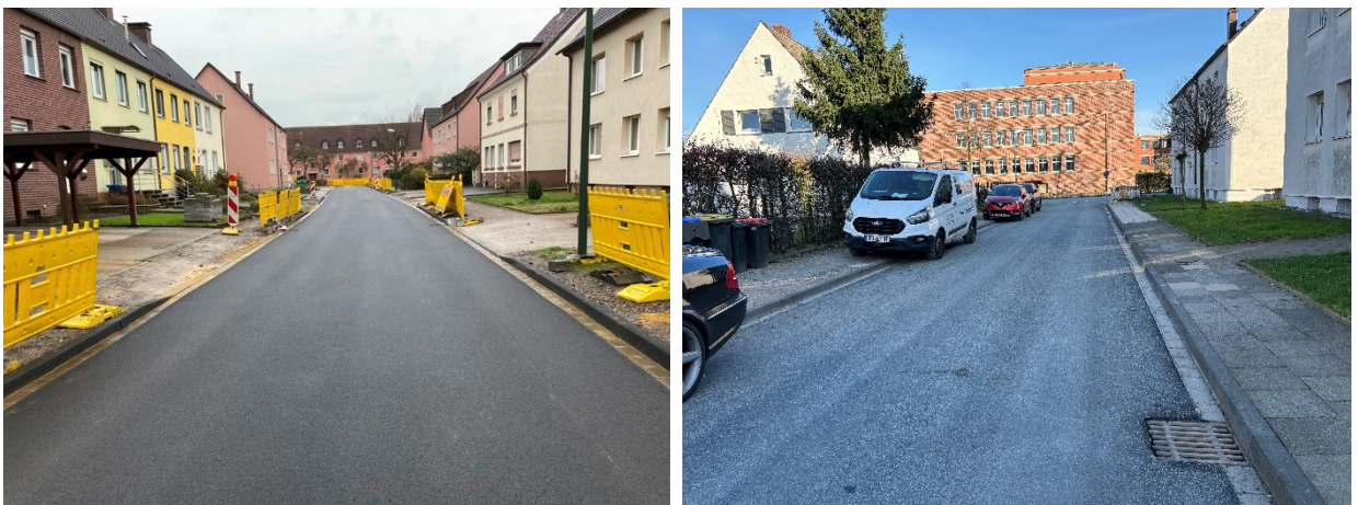
Robert-Koch-Str. Asphaltdeckschicht ist hergestellt