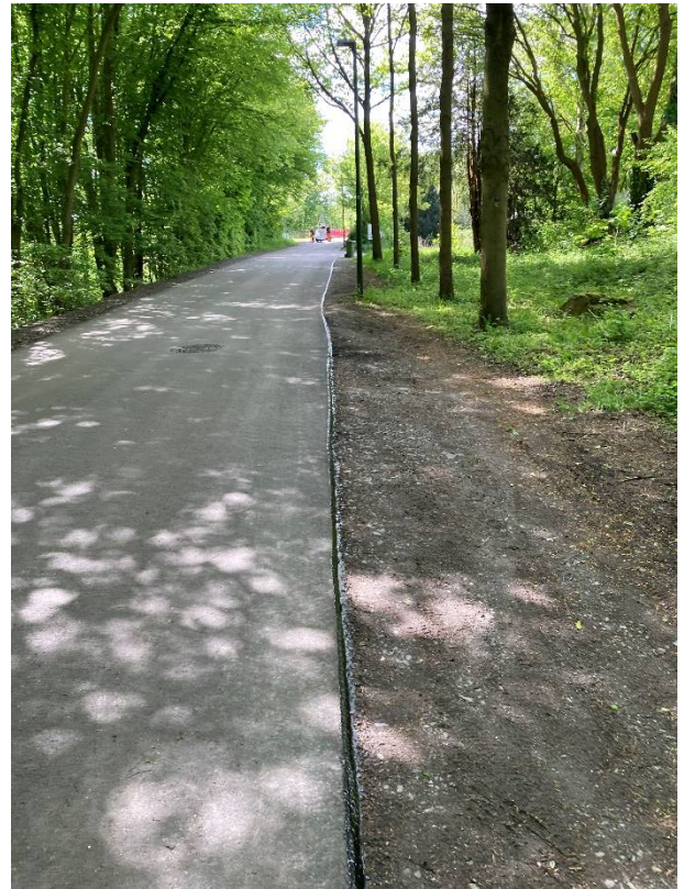
1. Bauabschnitt zw. Kamener Straße und Brücke Seseke