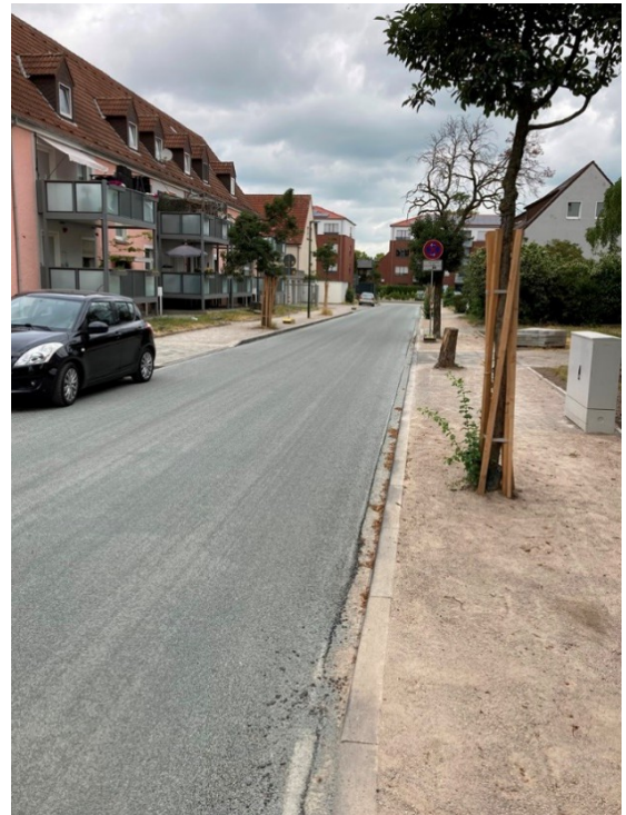
Röntgenstr. fertiggestellte Asphaltdeckschicht