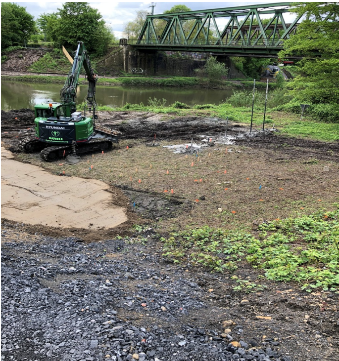
Lippebrücke; Sondierungsbohrungen im Bereich des gepl. Mittelpfeilers

Parallel zu den Arbeiten vor Ort werden die Werkstattpläne für die beiden Stahlüberbauten erstellt. Noch im Mai soll mit der Stahlbaufertigung der Lippebrücke im Werk begonnen werden.