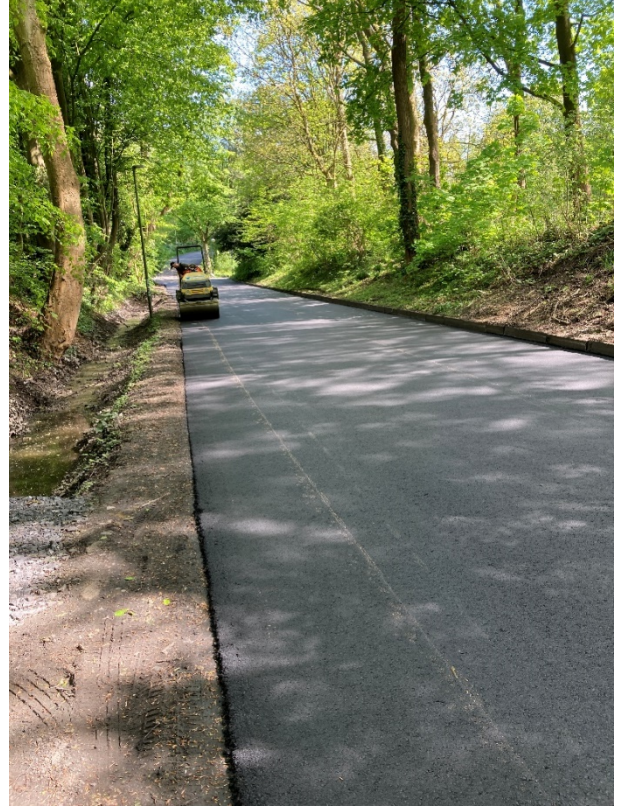
2. Bauabschnitt zw. Brücke Seseke und Seelhuve