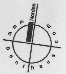
Lageplan Maßstab 1:500 / 28.04.2021