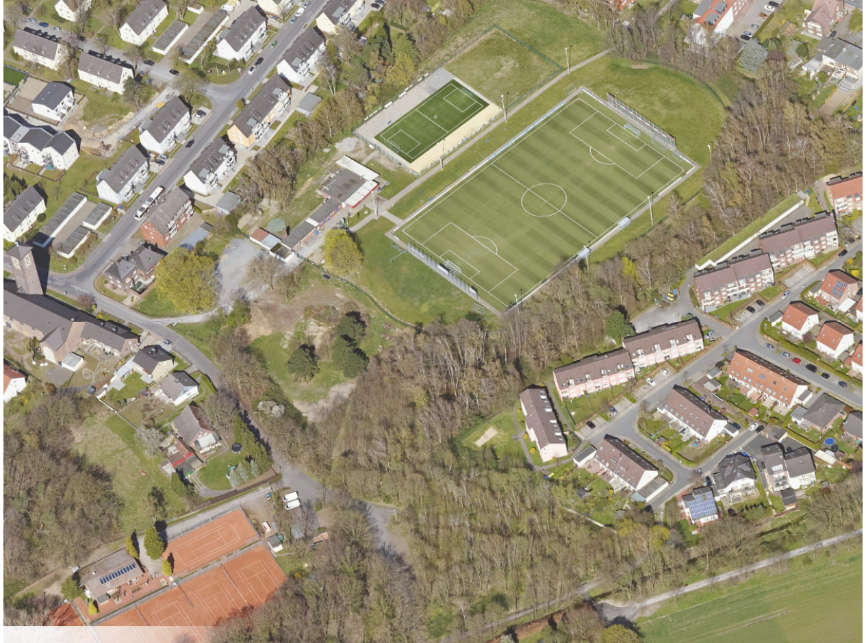
Anlage 3: Schrägluftbild