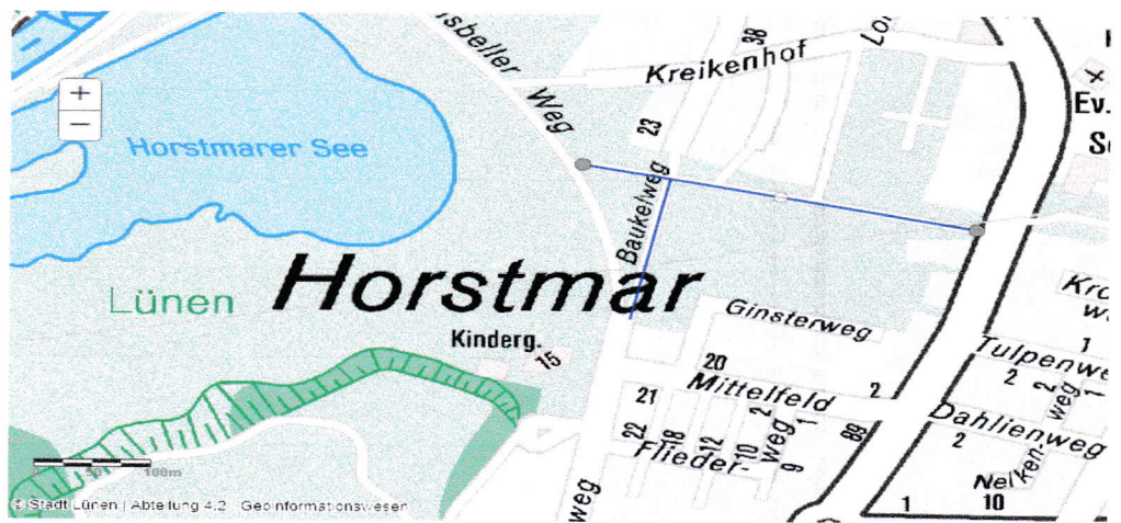
Abbildung 1: fehlende Beleuchtung auf den blau markierten Hauptwegen