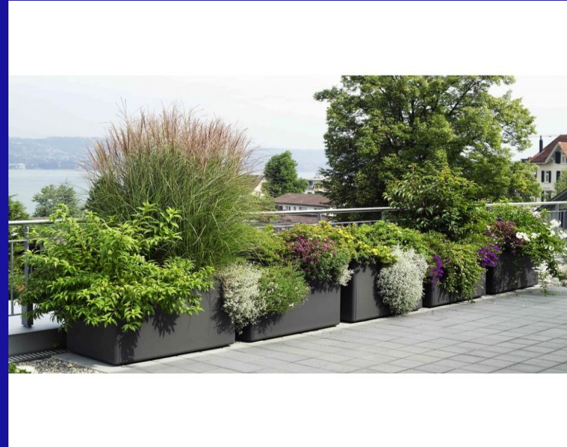
Beispiel mit Pflanztröge