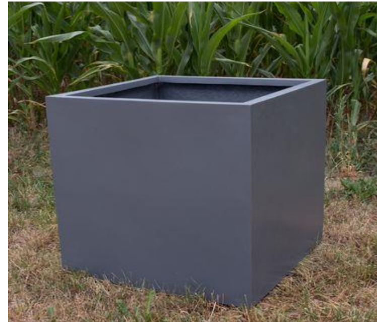
Beispiel mit Pflanztröge