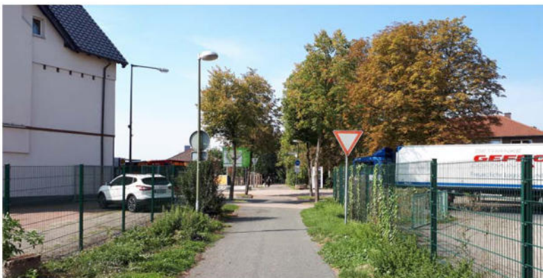
Bestandsfoto: Querung ehem. Zechenbahntrasse Blick Zechenbahn