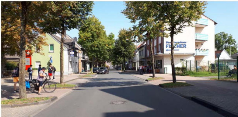
Bestandsfoto: Querung ehem. Zechenbahntrasse Blick Jägerstraße