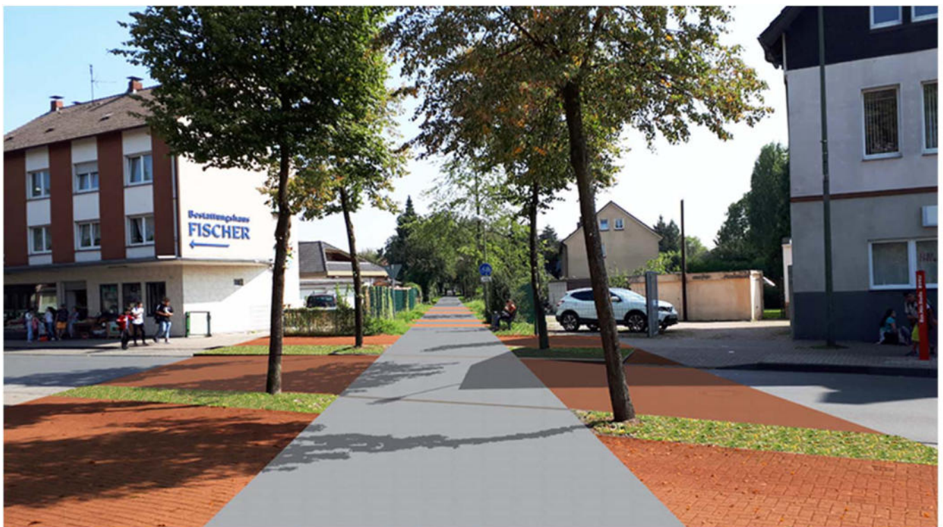
Querung Jägerstraße Blick Zechenbahn