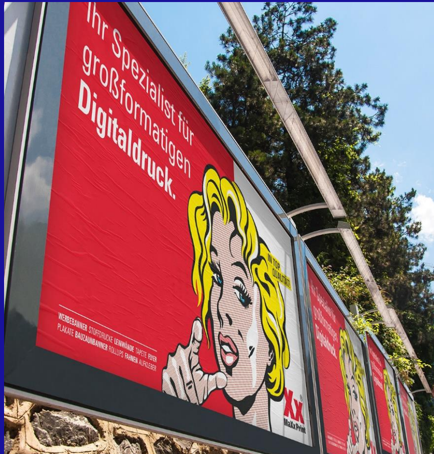
Plakatwand 18 / 1 mit Beleuchtung