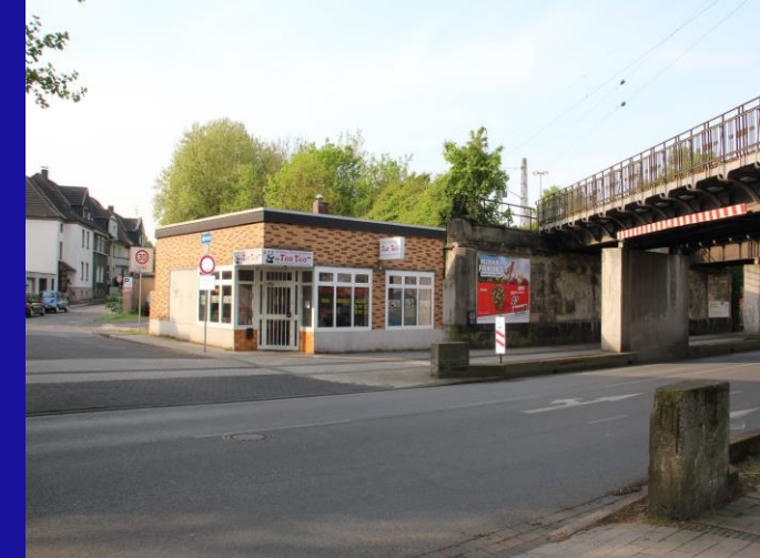
Gegenüberstellung vorher / nachher